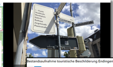
Bestandsaufnahme touristische Beschilderung Endingen